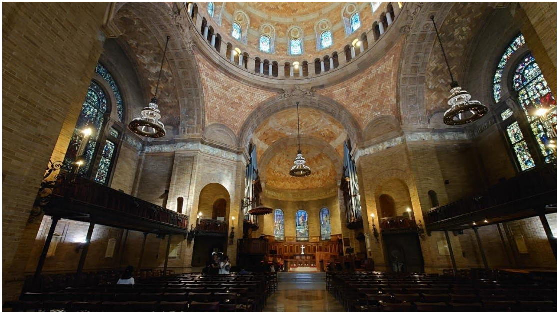
哥倫比亞大學內的教堂↑