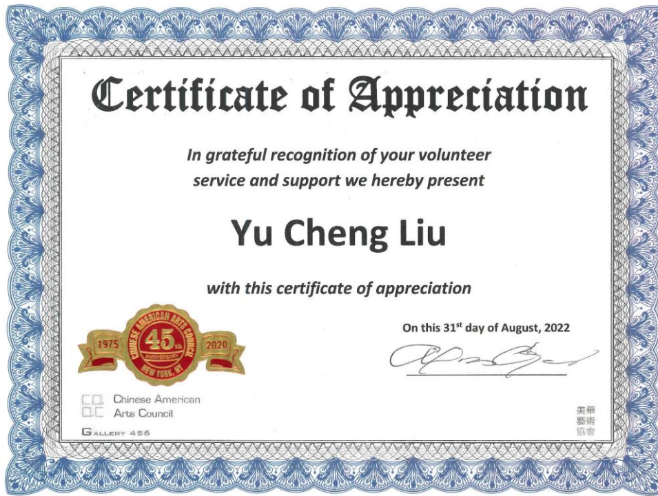
由美華藝術協會所頒發的感謝狀↑