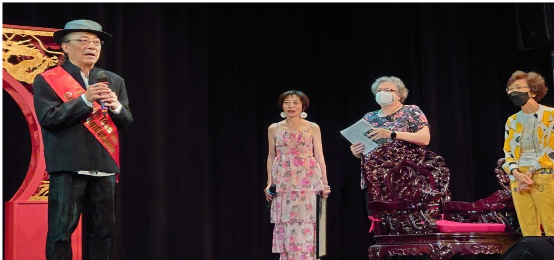
周興立教授在授勳典禮上致詞↑