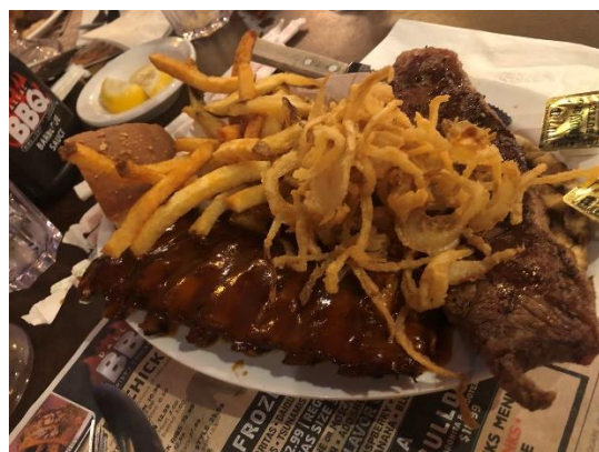
玻利維亞料理(左上) 墨西哥料理(右上) 韓式豆腐鍋(左下) 德州烤肉(右下)↑