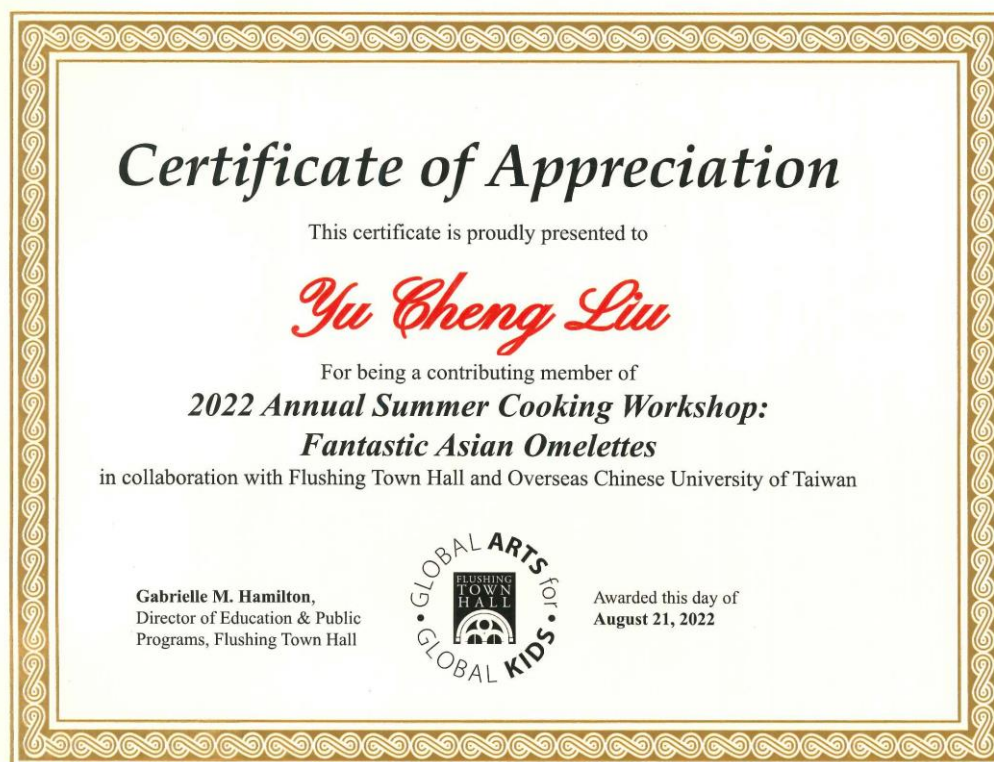
由紐約法拉盛文藝中心所頒發的感謝狀↑