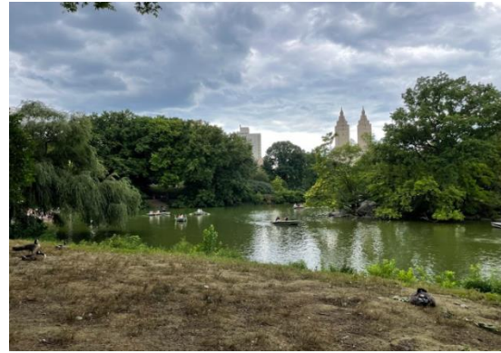
(左)美式經典早餐 IHOP，份量多又美味 (右)在中央公園散步隨手拍下的風景